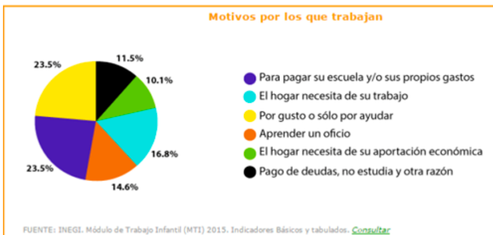
Tabla 2. “Instituto Nacional de Estadística y Geografía” 7 .

De ahí es que la OIT debe de considerar al trabajo infantil como una “plaga” que debe ser erradicada lo más pronto posible, para poder darle la oportunidad a los niños, niñas y adolescentes de tener las mismas oportunidades de estudiar y tener un buen futuro.